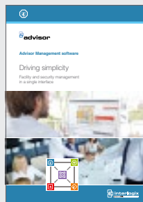
Advisor Management software brochure