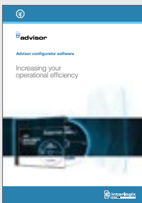
Advisor Configurator software brochure