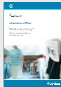
Advisor Advanced PIRcam brochure